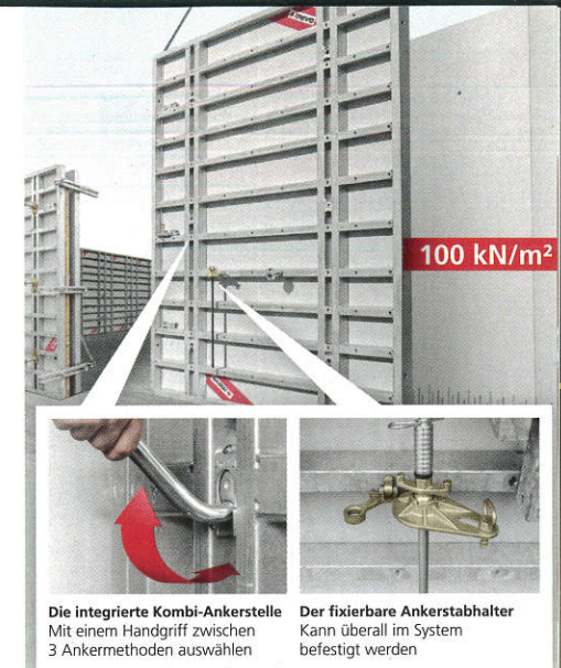
Die integrierte Kombi-Ankerstelle Mit einem Handgriff zwischen 3 Ankermethoden auswählen Der fixierbare Ankerstabhalter Kann überall im System befestigt werden

■ AUTOBAHNMEISTEREI BRUCK AN DER LEITHA: Auf einem 27.500 m 2 großen Areal direkt bei der Anschlussstelle Bruck/Ost errichtet die Asfinag bis Herbst 2019 eine neue Autobahnmeisterei. Diese besteht aus einem Bürogebäude, Werk- und Einstellhallen, Flugdächern für Lagerplätze, einer Salzhalle, einer Tankstelle, einem Rechenzentrum sowie der dazugehörigen Infrastruktur mit Außenanlagen und Retentionsfilterbecken. Mit der Autobahnmeisterei Bruck an der Leitha werden die beiden derzeit noch bestehenden Standorte Parndorf im Burgenland und Schwechat in Niederösterreich zusammengefasst.