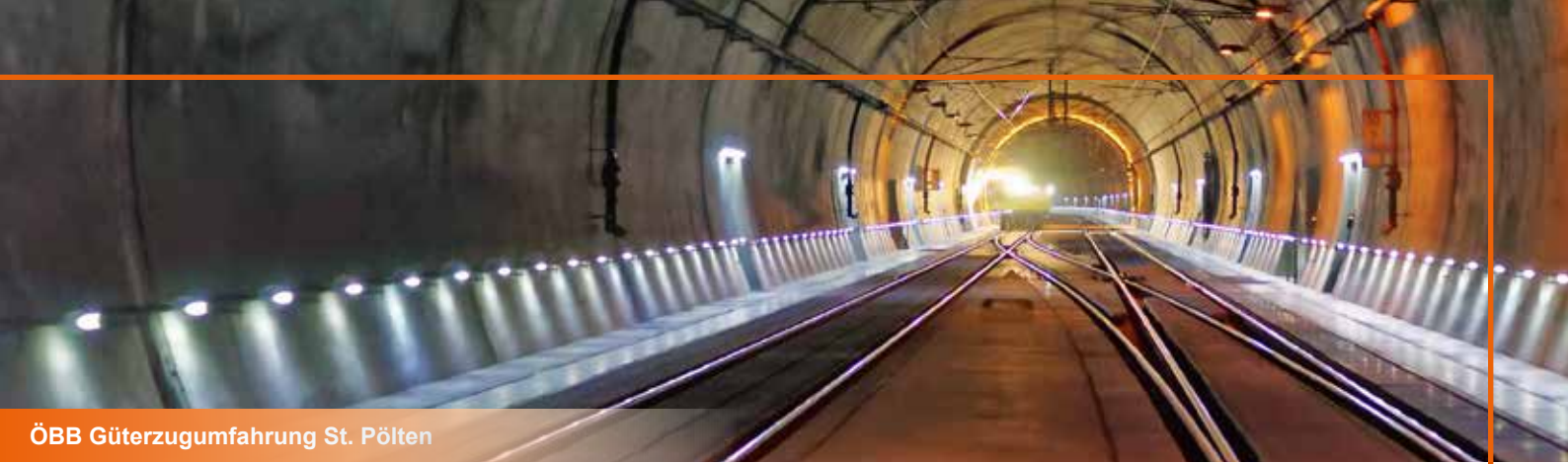
ÖBB Güterzugumfahrung St. Pölten