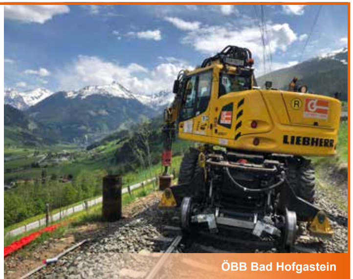
ÖBB Bad Hofgastein