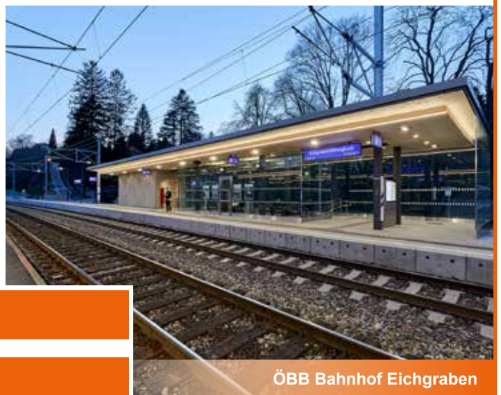
ÖBB Bahnhof Eichgraben