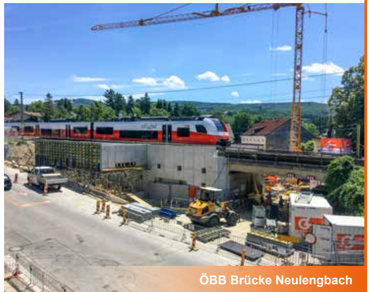
ÖBB Brücke Neulengbach